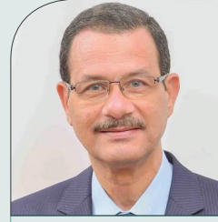
د/ أحمد درويش

وزير التنمية الإدارية سابقاً، جمهورية مصر العربية