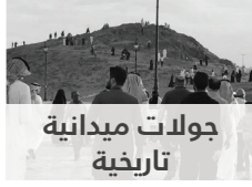
جولات ميدانية تاريخية